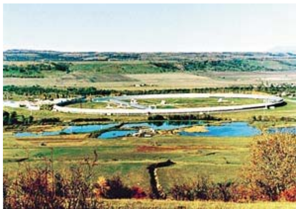
Российский радиотелескоп РАТАН-600 - один из самых больших в мире - 576 метров в диаметре.

К примеру, во Вселенной сейчас обнаружено 80 странных объектов - их назвали РОКОСами. По размерам они сравнимы со звездами, но есть у них странная особенность. Спектр нашего Солнца, как и всех других звезд, изрезан так называемыми линиями поглощения. Эти линии - своеобразные «отпечатки пальцев» разных типов атомов химических элементов, находящихся на звездах. Так вот, у РОКОСов этих линий нет совсем, и внятных объяснений этому феномену пока не существует! Почему бы не допустить, что это некие маяки, поставленные